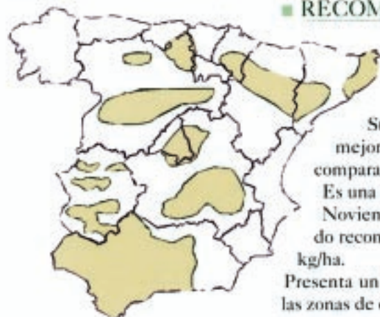
■ Zonas de Cultivo

Destaca por su nivel productivo superior al de CARTAYA. Su mejor comportamiento se obtiene en las tierras más fértiles (regadíos y secanos frescos).